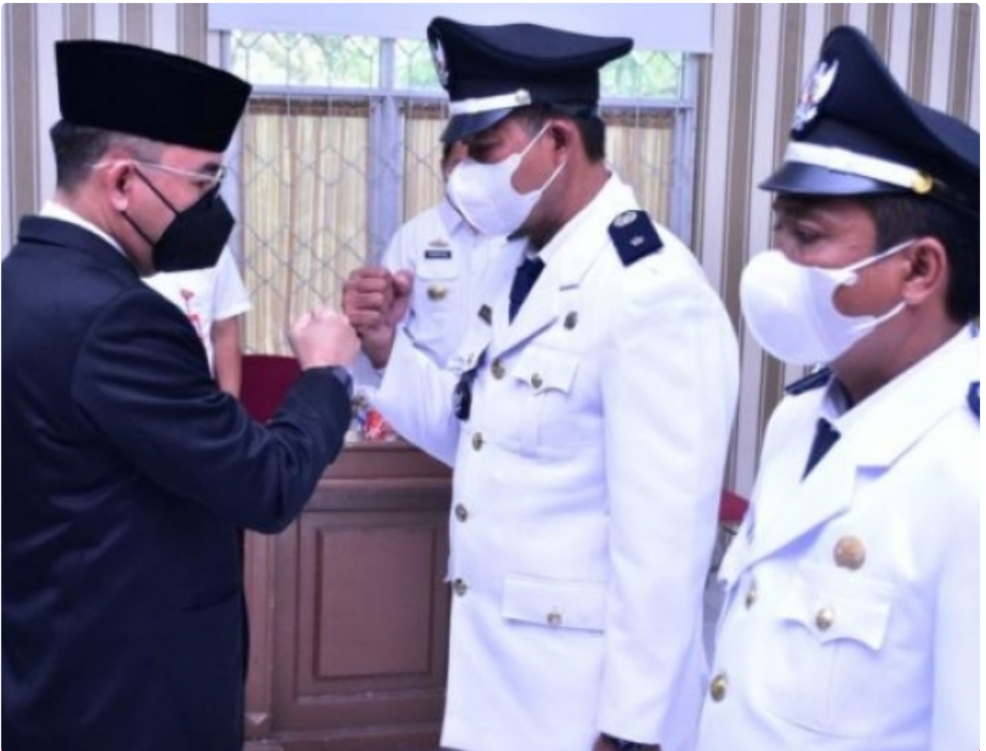
Raden adipati lantik pj kakam dan kakam definitif kec. Rwbang tangkas dan pakuan ratu